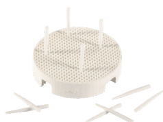
Vassoio di cottura, set Art. # 106490