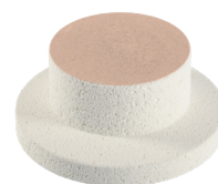
Tavolo di cottura, Forno a timbri multipli Art. # 101734