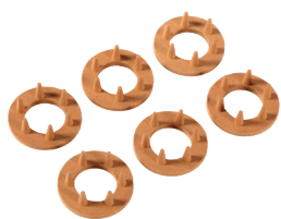
Supporto in ceramica (6 pezzi) Art. # 105488