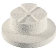
Tavolo della stampa, Sistema di stampa a timbri multipli Art. # 101726